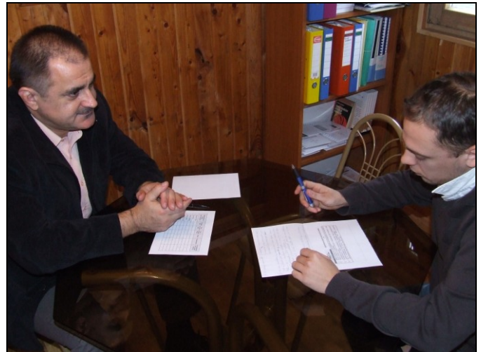
Mennyi az annyi?