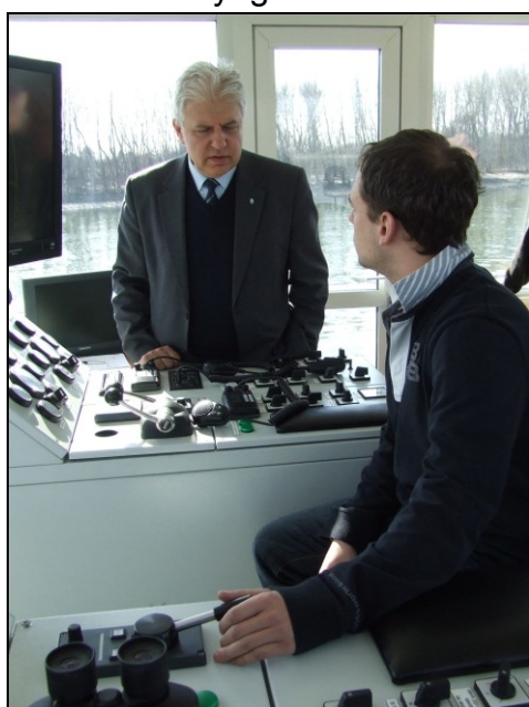
Mi a feladat?