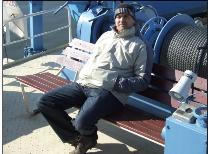
Az aggódó diri