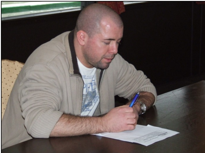
Hát ilyen nincs!