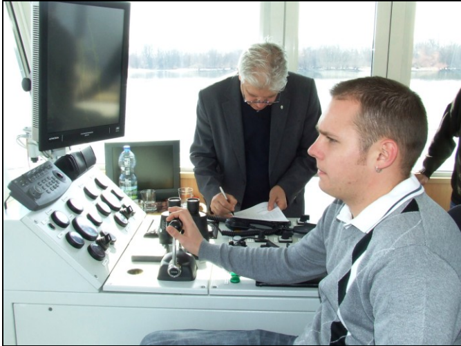
Mit is mondtak?