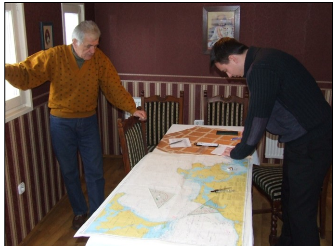
Mérjük csak meg pontosan!