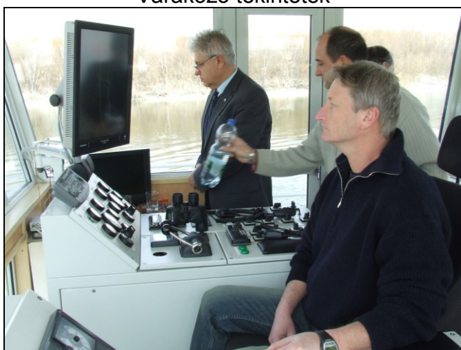
A nyugodt erő