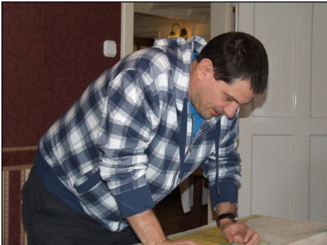
Ez itt a tenger!