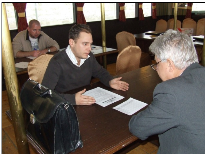
Ekkora házi vizsgát tettünk!