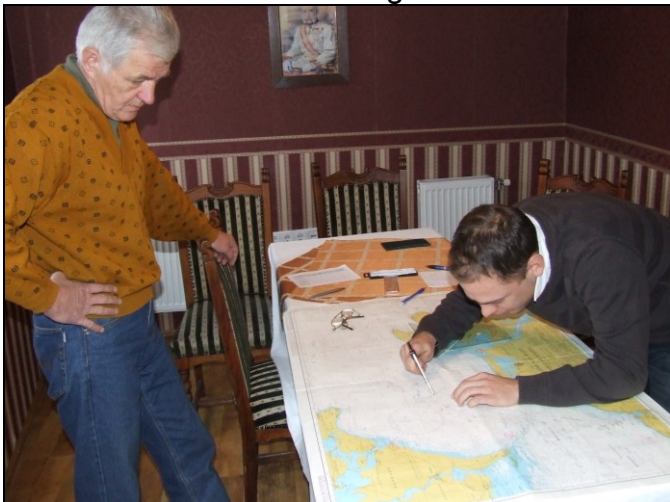
Hasaljunk a tengerre és mérjük!