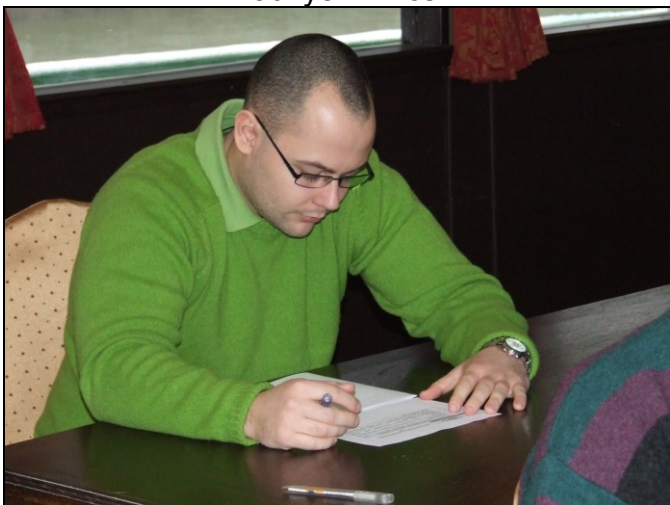
Mi a fene?