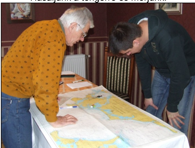
Odalenn a tenger!