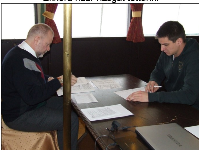
Keresem a szót!