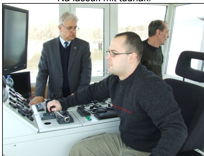
Na nyomjuk meg!