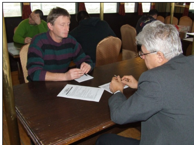
Fárasztó a házi vizsga!