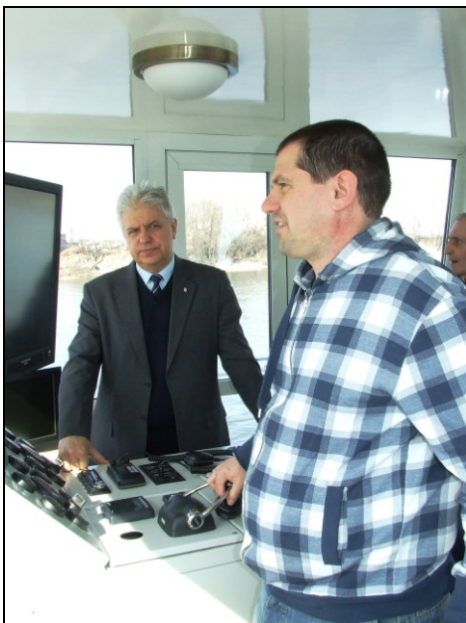
Megy ez nekünk!