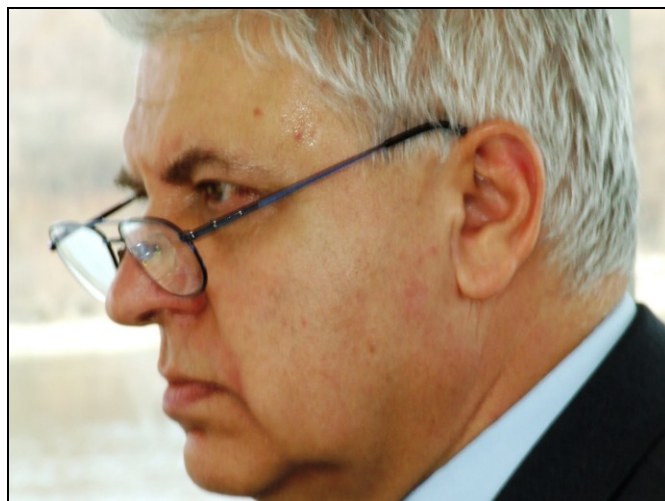
Na lássuk mit tudnak!