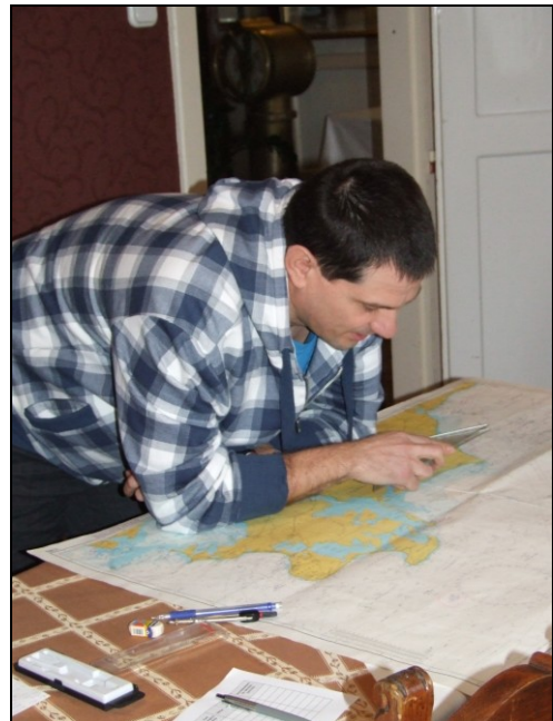
És oda akarunk menni!