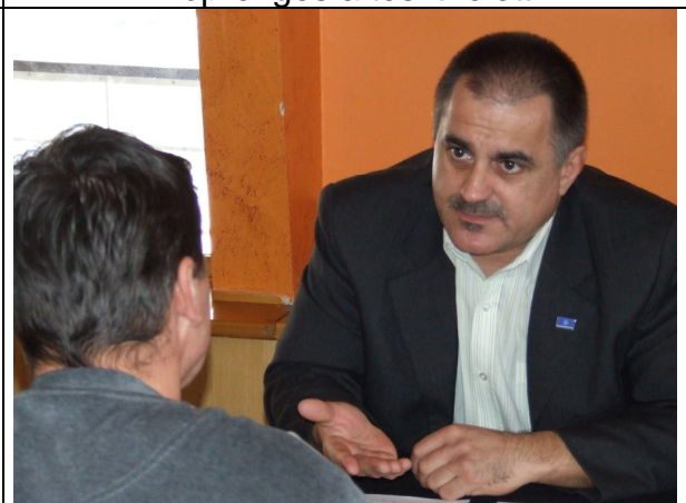
Mi történik ha rossz üzletet köt?