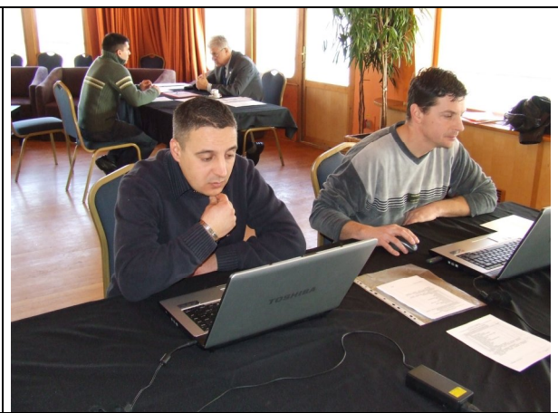
Töprengés a teszt felett