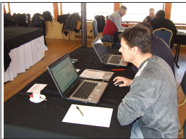
Mi a frász ez?

Hallgatóink többsége „A” kategóriás hajóvezető képesítést szerzett, néhányan „B” kategóriást és négyen szolgálati célú nagyhajó-vezető képesítést. A hajóvezetői tanfolyam szünetében azok a hallgatóink, akik még nem rendelkeztek URH rádiókezelő képesítéssel, tanfolyamon vettek részt és hatósági vizsgát is tettek. A gyakorlati vizsgát két részletben, néhány nem tanfolyamos kolléga részvételével bonyolítottuk le a Hídépítő Speciál kiváló képességű tolóhajójával, a Zsombor motorossal. A házi vizsgákról és a hatósági vizsgáról néhány életképet mutatunk be: