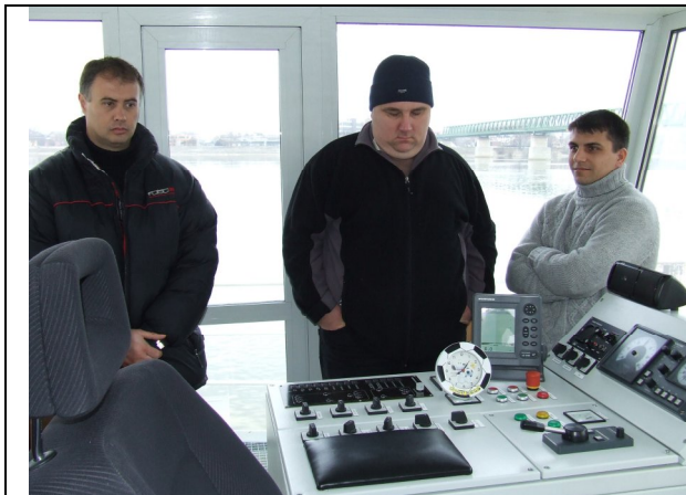
Vizsga előtti erőgyűjtés