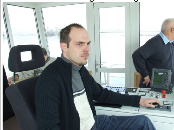
Csak kijön a rundó!