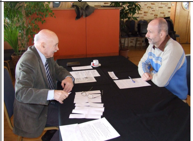
...és ha félretesszük a jogot?