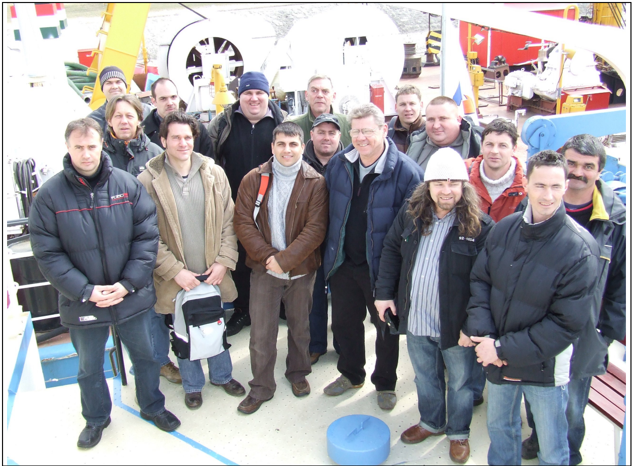
Túl vagyunk rajta!!!