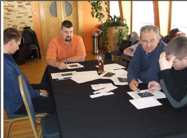
Mit látunk a radarképen?