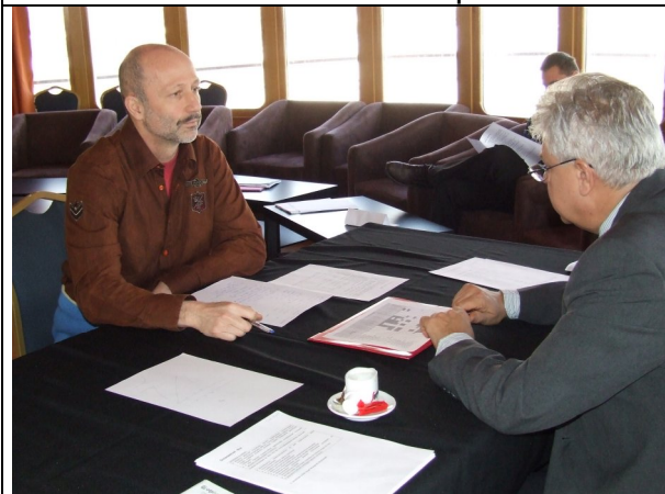
Héderelünk a vonalon?